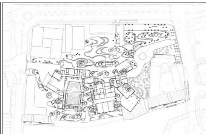
Im Norden des Gebäudekomplexes liegt ein großzügiger Platz, im Süden wird das Areal von einem Kanal begrenzt. Die Erdgeschosszone ist offen und durchlässig gestaltet und ermöglicht es Passanten, das Ensemble als erweiterten Stadtraum zu nutzen.

➔ Fassadenbild, dessen Schattenwurf und Farbgebung sich mit dem Lauf der Sonne wandelt. Das Format der Ziegelplatten mit einer Höhe von 875 mm und einer Breite von 140 mm erinnert an traditionelle Ziegelformate und stellt so wiederum einen Bezug zur Geschichte her.